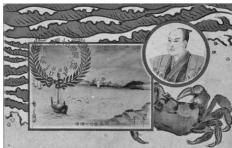
図1 横浜開港祝賀会発行の記念絵はがき トンボヤ製 右上が神奈川奉行松平石見守康直の顔。