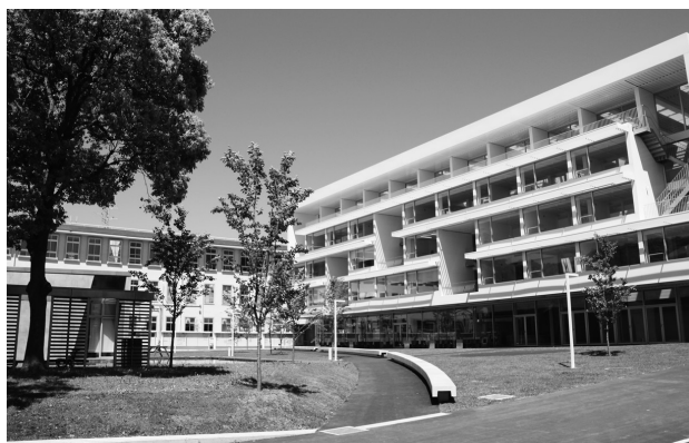
金沢八景キャンパス