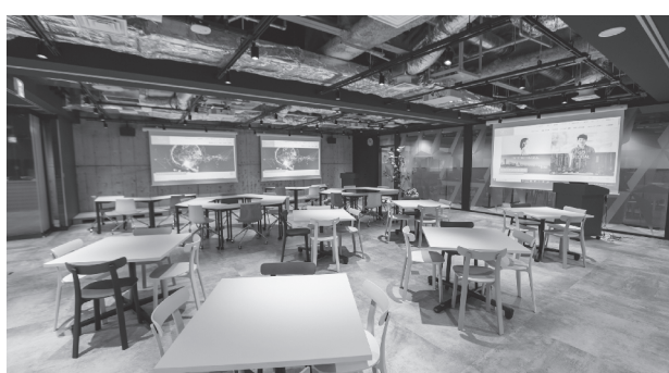
みなとみらいサテライトキャンパス

ムを物質科学の立場から解明し、創薬・医療や食料・生物環境など人類社会の持続的発展のために必要な諸問題の解決策を見出すべく、これまでの物理・化学・生物の融合をさらに進め、高度な科学技術を担う人材、また産業の活性化に関わる諸問題に対して積極的に取り組む人材を育成します。