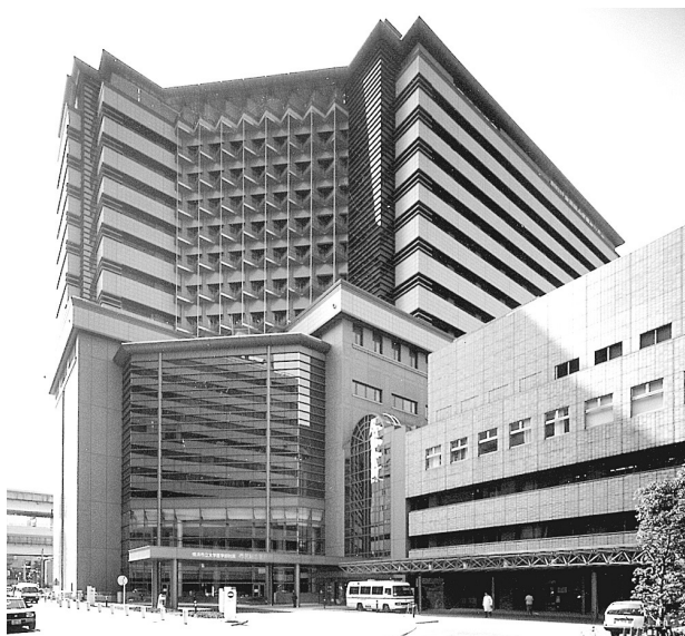
附属市民総合医療センター（市大センター病院）