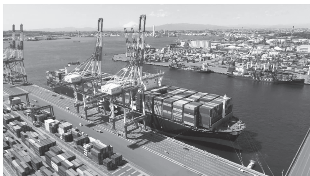
国内最大級の南本牧ふ頭コンテナターミナル

さらに、南本牧ふ頭は、市民生活から発生する廃棄物の焼却灰等を長期にわたり安定して受入れる役割も担っています。