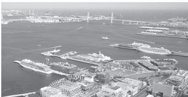
「5隻のクルーズ船」 (横浜港客船フォトコンテスト2023 横浜市港湾局長賞作品より)

より多くの人に客船や港に興味をもっていただくため、平成16年から他団体と共催で、「横浜港客船フォトコンテスト」を実施し、入賞作品を大さん橋国際客船ターミナルなどで展示しています。