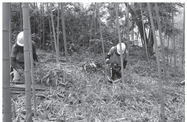
金沢自然公園での森づくり体験会（初級編）