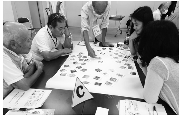
環境教育出前講座「生きもののつながりってなんだろう？」

生物多様性の損失や地球温暖化といった環境問題への理解を深めるため、市内の小中学校や地域の方々を対象に、市民団体、企業、国際機関、市役所など専門知識を持った講師が講義を行う「環境教育出前講座」を実施しています。令和5年度は87回開催しました。