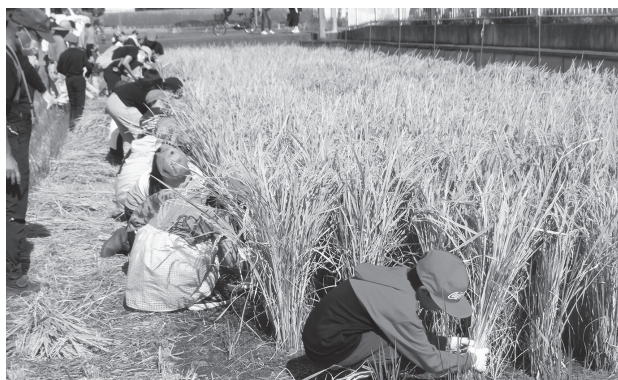
北八朔恵みの里での体験水田