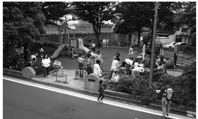
公園愛護会の活動