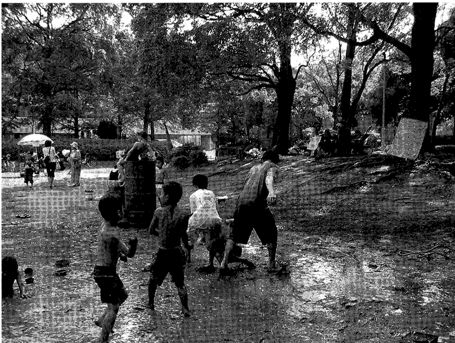
港南中央公園プレイパーク事業の様子

め調査研究や検証活動が不可欠であると考える。アリスセンターでは、本調査結果を活かしつつ、引き続き、協働事業の成果検証のあり方について検討を重ね、市民社会の基盤整備に寄与しうる協働事業の「効果測定基準」について、提案を行なっていきたい。