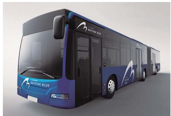
▲ たくさん ひと の人が乗 の ることができる新しい あた バス ばす