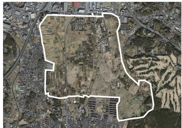
▲2015年6月までアメリカの軍の「上瀬谷通信施設」だった所