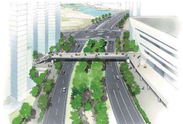
▲ 「みなとみらい」に人 ひと が歩 ある いて渡 わた ることができる橋 はし をつくれます。