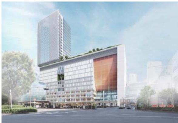
▲ 横浜 よこはま 駅 えき の西口 にしぐち にできる予定 よてい の大きなビル おおびる 。店 みせ や会社 かいしゃ などが入ります。

横浜 よこはま 駅 えき などがある「都心臨海部 ひとくとしんりんかいぶ 」、新横浜 しんよこはま 駅 えき などがある「新横浜都心 しんよこはまとしん 」、工場 こうじょう が多い「京浜臨海部 おおけいひんりんかいぶ 」などをもっと元 げん 気に き します。