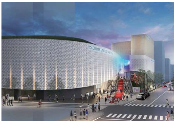
▲ スポーツの試合 すぽーつしあい などを行う「横浜文化体育館 よこはまぶんかたいいくかん 」の建物 たてもの を新しく あた ります。