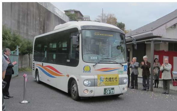
▲住んでいる人たちが意見を出して、新しく走り始めたバス