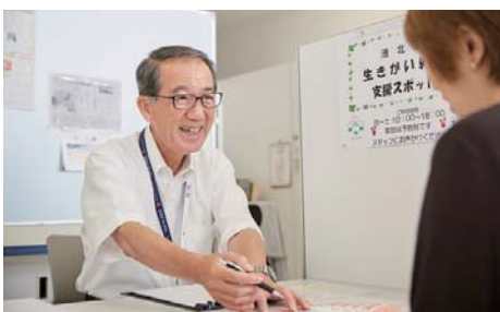
◀ 働く女性のためのイベント

働く女性が情報を集めたり交流したりできるイベントを開きます。会社をつくりたい女性や、女性のリーダーを育てるための手伝いをします。