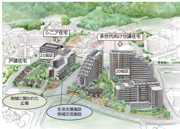
▲「緑区十日市場」をずっと住み続けることができる所にします。

生活に便利で、若い人もお年寄りも住みやすいまちにします。アメリカの軍が使っていた広い場所などは、自然を残しながら、みんなの役に立つようにうまく使います。