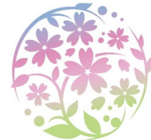
ボッシュ ホール Tsuzuki Ward Culture Center 都筑区民文化センター