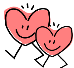
写真は昨年の様子です。