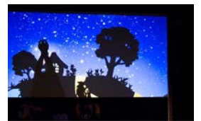
▲かかし座 公演の様子