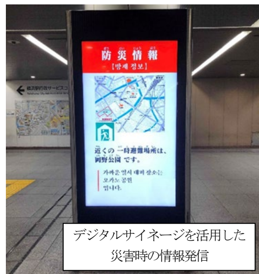
デジタルサイネージを活用した 災害時の情報発信