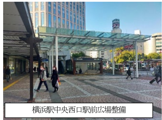
横浜駅中央西口駅前広場整備