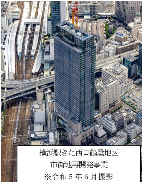
横浜駅きた西口鶴屋地区 市街地再開発事業 ※令和5年6月撮影