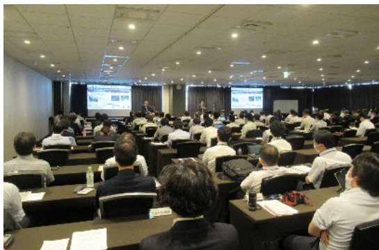
プレゼンテーション会場