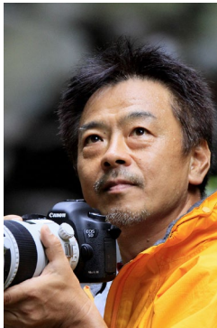
写真家 豊田 直之 氏