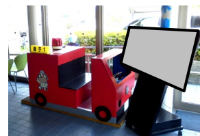
磯子消防署（イメージ）