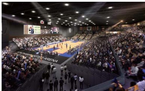
※内観イメージ（スポーツ時）

旧横浜文化体育館敷地に立地する、延床面積約 15,000 m 2 、3階建て、観客席の一体感を生む扇状（U字状）の劇場型アリーナで、観客席約 5,000 席を有します。市民スポーツ等の大会だけでなく、プロスポーツやエンターテイメントなどのイベント開催が可能な施設です。