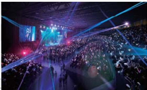
※内観イメージ（コンサート時）