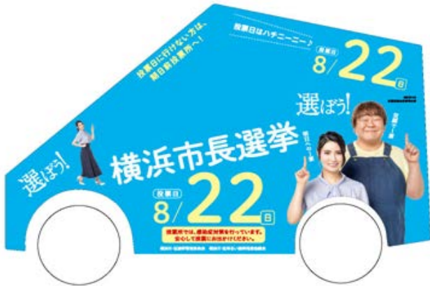
中区、保土ヶ谷区、旭区、緑区