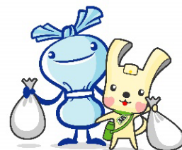
横浜市資源循環局マスコット イーオ・ミーオ

節目の開催にあたり、改めて「中華街をきれいな町にしよう！」というスローガンを掲げ、誰もが気持ちよく過ごせる中華街の実現を目指し、「中華街一斉クリーンアップ」を実施します。