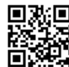
ダウンロード こちら