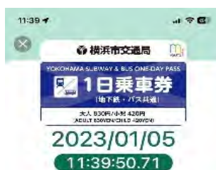
スマートフォンアプリ「my route」