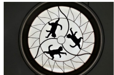
踊場駅にある猫のモチーフ （一部）

踊場駅の駅空間は、憩いの広場をイメージした、柱のない大きなドーム空間のある個性的な駅となっており、関東の駅100選にも選定されています。