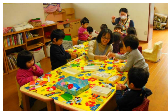
【乳幼児一時預かり事業】 （青葉区・子どもミニデイサービス まーぶる）