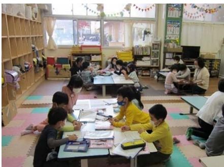
【放課後キッズクラブの活動】