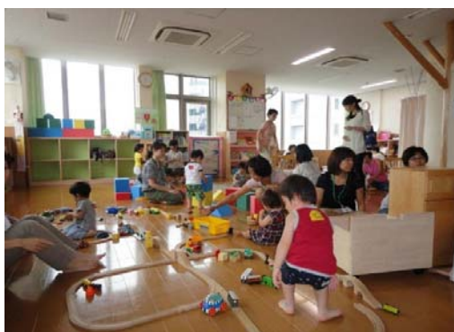
【地域子育て支援拠点】 （戸塚区・とつとの芽）