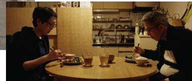
2023年広島国際映画祭出展作品