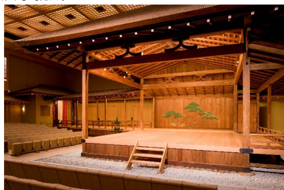
▲横浜能楽堂本舞台