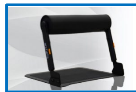
認定商品「スタビハーフ」