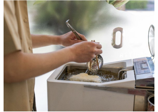
認定商品「クールフライヤーCFT-7」を利用した調理イメージ