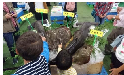
【タッチプールイメージ】