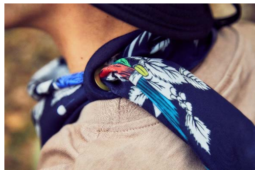
エクストリームシルク DURE55