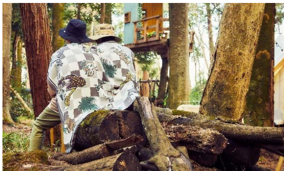
エクストリームシルク DURE110