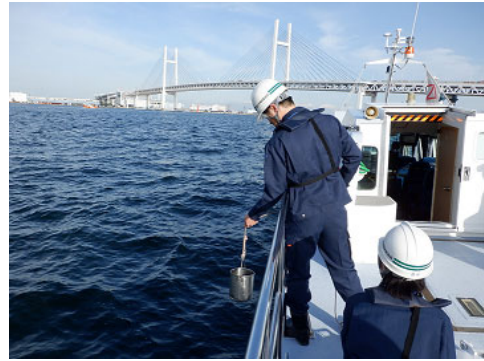
水質調査イメージ

本調査に参加された方々から提供いただいたデータをもとに、「東京湾環境マップ」を作成し配布しています。