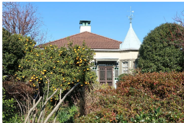
港の見える丘公園(拡張部)に移築予定の西洋館

また、今回、対話参加事業者へのインセンティブ付与(事業者公募の審査時に加点)の2回目の試行に取り組みます。