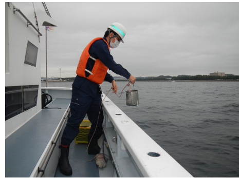
水質調査イメージ

本調査に参加された方々から提供いただいたデータをもとに、「東京湾環境マップ」を作成し配布しています。