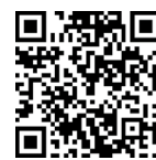
▲ 東部病院への アクセス

（※）時間外選定療養費とは、救急医療体制を維持するため、当該医療機関の診療時間外に、緊急の必要がなく受診を希望する患者等に対し、診療費とは別に費用を求める制度です。