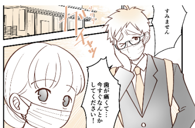
池田すっぽんマニア さん