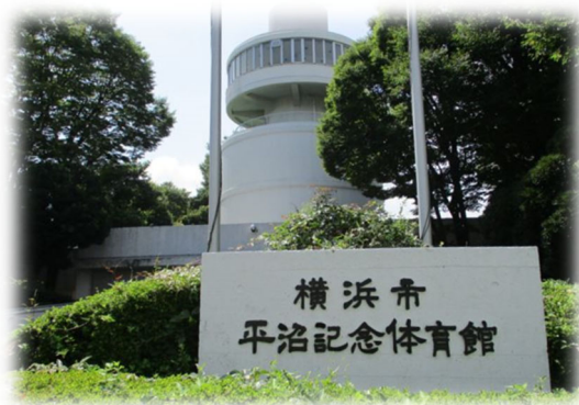
平沼記念体育館（スポーツ施設）