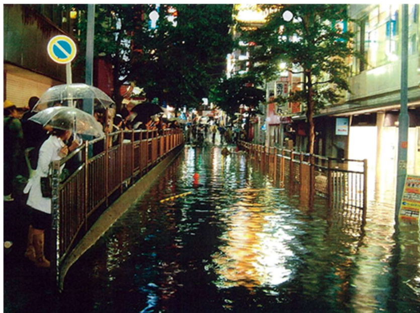
写真-1 平成 16 年台風 22 号横浜駅西口浸水状況

平成 16 年には、台風によって横浜駅西口周辺で大規模な浸水被害が発生し、地下街に雨水が流れ込むなど、大きな被害を受けました。そこで、人孔内の水位情報をリアルタイムに公表することで、市民や地下街管理者の皆様へ水防活動等への活用や、大雨時における迅速な対応へと繋げていただくことを目的として、令和 3 年 6 月から、横浜駅周辺の下水道管内水位情報の発信を開始しています。