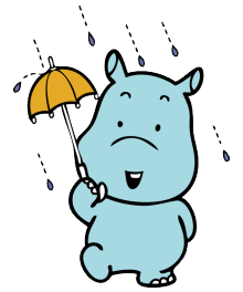
横浜市水環境キャラクター かばのだいちゃん