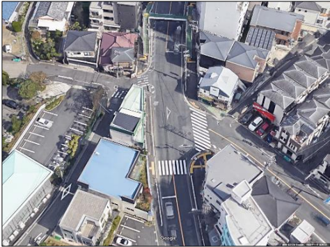
調査箇所候補③: 西六浦交差点(金沢区) 交差点の特徴: 特殊な交差点形状