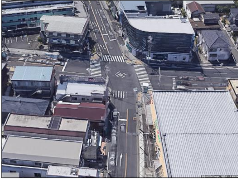
調査箇所候補①: 立場交差点(泉区) 交差点の特徴: 標準的な交差点形状