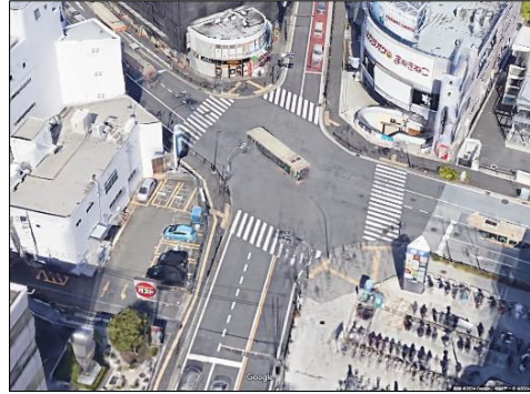
調査箇所候補②: 上倉田交差点(戸塚区) 交差点の特徴: 歩行者通行が多い