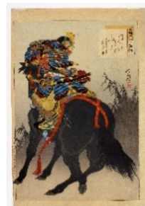
◀英雄三十六歌撰 「畠山重忠」 (馬の博物館所蔵)

清廉潔白、誠実、思いやりがあり、怪力の持ち主であるとともに、芸事にも秀で「知仁勇」を兼ね備えた名将ですが、幕府の権力争いにまきこまれ、鎌倉に向かう途中、現在の横浜市旭区鶴ヶ峰付近で討ち死にしました。