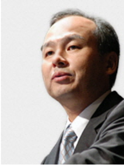
ソフトバンクグループ株式会社 代表取締役会長兼社長 孫 正義氏

経営理念である「情報革命で人々を幸せに」とJCIの理念である「恒久的世界平和の創造」を掛け合わせ、「情報革命×世界平和」をテーマに講演いただきます。