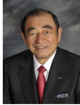
富士フイルムホールディングス株式会社 代表取締役会長・CEO 古森重隆氏

写真フイルム中心の会社から大胆な業態転換に成功し、ヘルスケアをはじめ幅広い分野で事業を展開する富士フイルムの挑戦し続ける企業姿勢、そして事業活動を通じて社会課題の解決に貢献していくことを経営の根幹に据える古森会長の経営理念について講演いただきます。