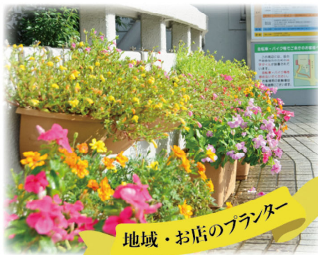
地域・お店のプランター