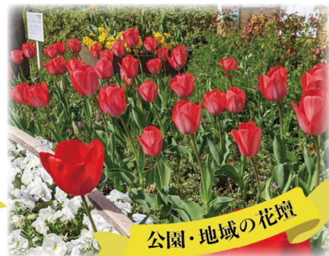
公園・地域の花壇