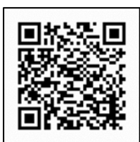
汎用型フォトフレーム