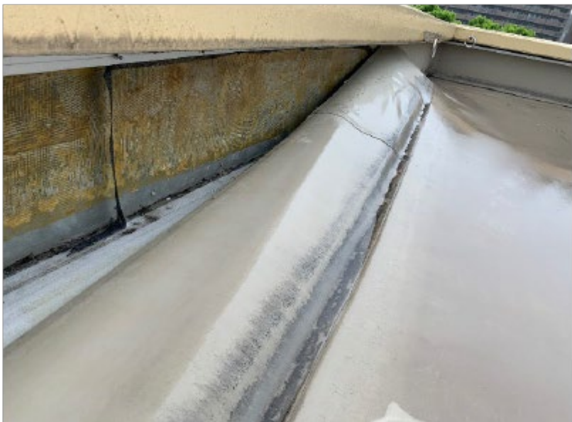
塩ビシート防水(厚さ2mm、機械固定式)の北側の防水部分(約20m)が引っ張られ完全に剥がれている。