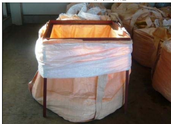
■フレームのフレコン設置状態

ウ 受託者は、予定数量に必要な枚数を受託者の責において想定し、必要なフレコンの枚数を用意及び保管場所へ納品するものとする。