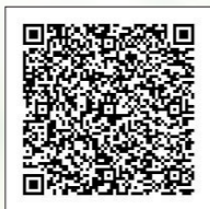
横浜市電子申請・届出システム 検索