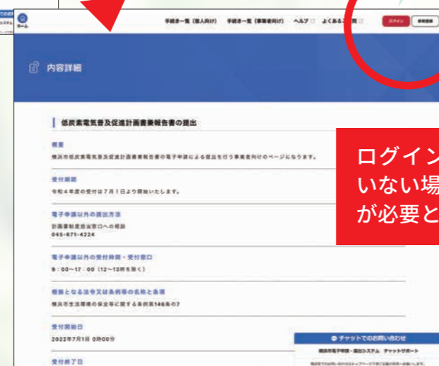
低炭素電気普及促進計画書兼報告書の提出