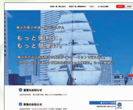
横浜市電子申請・届出システムTOPページ