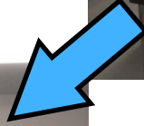
シュレッダー溶解作業