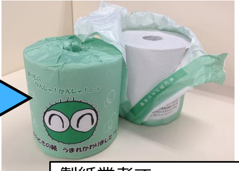
製紙業者で トイレ用紙等に再生