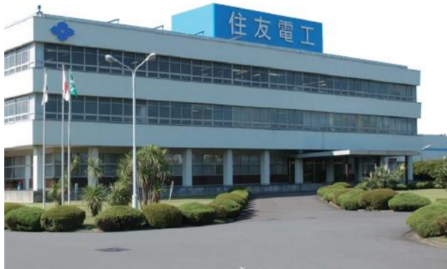
横浜製作所の全景