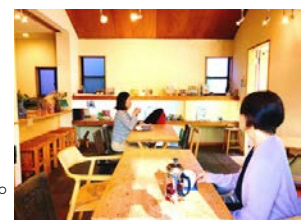
港北区 NPO 法人街カフェ大倉山ミエル