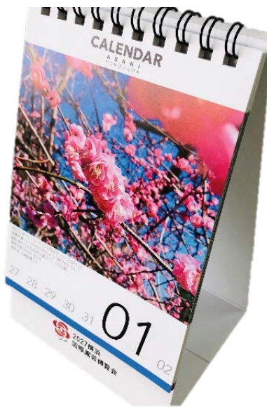
<組み立てイメージ>