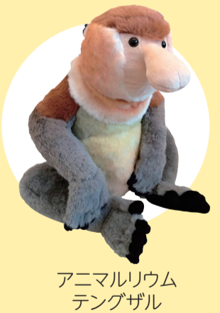
アニマルリウム テングザル