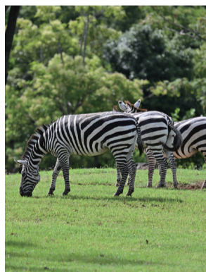
▲縞模様には カモフラージュの効果もある