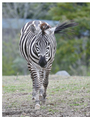
▲正面から見ると 縦縞と横縞がよく分かる

ズーラシアでは、雄1頭、雌3頭を飼育していますが、主に雌が運動場に出ていて、キリン、エランドと一緒に過ごしています。偶数日は、チーターもその中に混ざります。4種類の動物の関係は一言では言い表すことができません。じっくりとご覧いただき、単純そうで複雑な関係をお楽しみください。