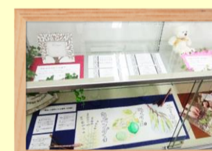
ベビーマッサージ他 高岡 悦子氏