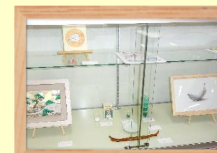
絵画指導 新倉 佳奈子氏