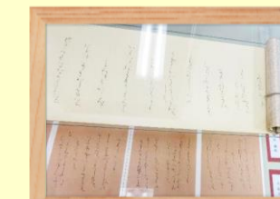
書道 永松 立江氏