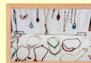
マクラメジュエリー 関口 朋美氏