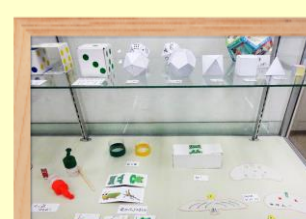
工作 伊原 誠氏