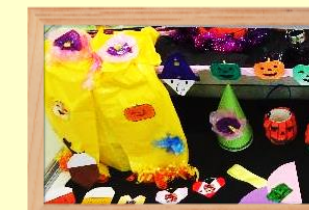
手作りおもちゃ 保育ボランティアグループてとと