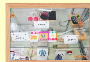
科学実験と工作 おもしろ科学たんけん工房