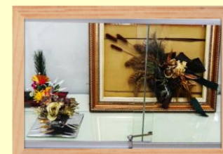
フラワーアレンジメント 今関 恵美子氏