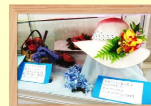
生花アートフラワー 桜林 裕子氏