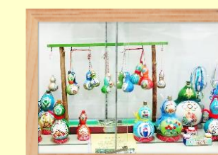
ひょうたん絵付け他 久下 勇次郎氏