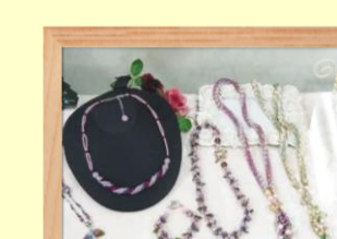
ビーズ 芝本 光子氏