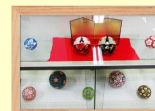
手まり 駒井 晴子氏