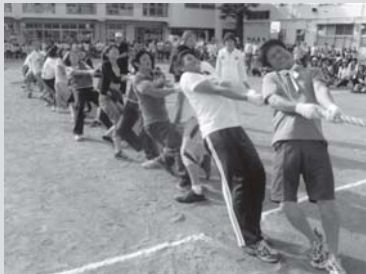
(ニュータウン大運動会)

運動会・夏まつり・敬老のつどい・音楽祭・福祉まつり・もちつき大会をはじめ、様々な事業が連合町内会・地区社協などの地域団体や愛好会などにより活発に取り組まれ、住民の日常的な交流に一定の成果を挙げています。しかし、一方で地域活動に無関心な層との二極化が進んでいます。