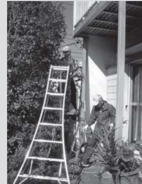
(チョコットしえんたい)

平成19年 3月、生活支援を目的とした有償ボランティア「チョコットしえんたい」が組織され、要援助高齢者・障害者世帯を対象に、草むしり・庭木の剪定・包丁研ぎ・家具の移動固定・障子や網戸の張替え等々、多岐にわたり生活支援が実施されるようになりました。年々利用が拡大しています。