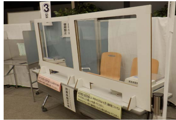
↑全ての窓口にパーテーション

緊急事態宣言下で横浜市長選挙が行われるなど、新型コロナウイルス感染症の影響を受けながらの異例の選挙執行となりました。様々な対策物品の導入をはじめ、従事者の皆様への説明・注意喚起の徹底など、選挙人の方々の安心・安全を守る多くの工夫を行い、無事に2度の選挙を乗り越えることができました。