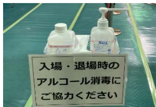
→アルコール消毒液をこまめに配置