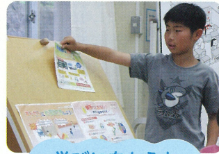
学びに向かう力 人間性など

「幼児期の終わりまでに育ってほしい姿」を手がかりに、 園と学校双方の子どもの成長の様子や手立てなどについての 相互理解や協働を目指します。（「幼保小の架け橋プログラム」の実施）