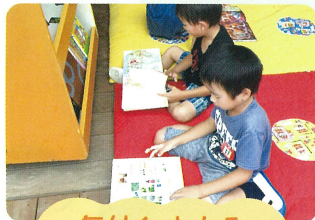
気付く・わかる やってみようとする