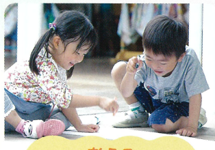
考える 試す・工夫する