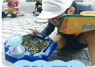
思考力・判断力 表現力など